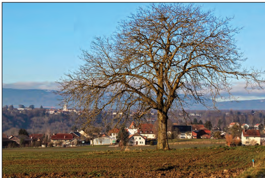
Bernard Cavat a gagné le concours et reçoit un bon pour une carte journalière d'une valeur de CHF 35.-