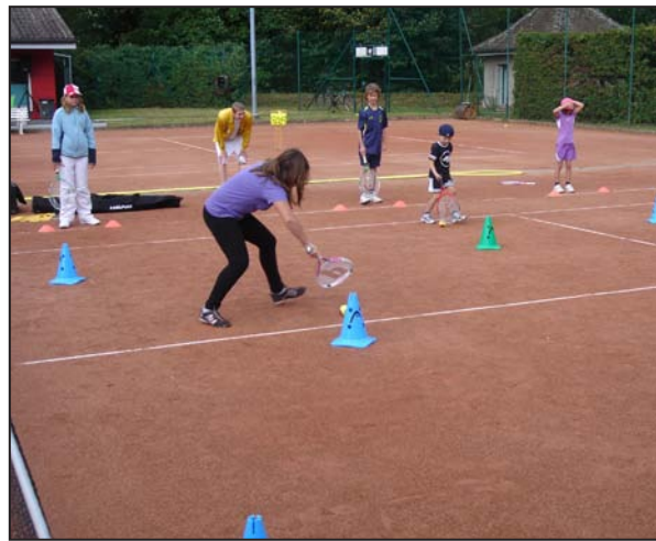
L'apprentissage du tennis par le jeu