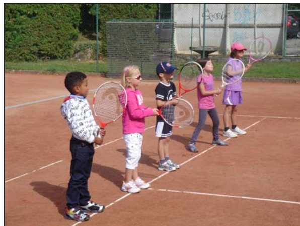
Les jeunes participants sont attentifs