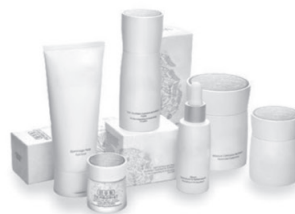
Emballages de lessive, pots de crème et de cosmétiques.