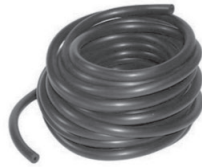
Éléments en caoutchouc, tuyaux de jardin.