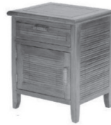
petit mobilier, objets divers jusqu'à 60 cm