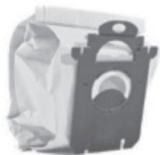
Sacs d'aspirateurs, déchets de nettoyage.