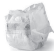
Couches-culottes, serviettes, tampons hygiéniques.