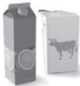
Berlingots de lait ou de jus de fruits en carton plastifié.