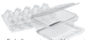
Emballages et petits objets en plastique, plastiques alimentaires tels qu'emballages de viande, de légumes.