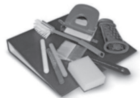
Produits d'hygiène tels que coton-tiges, lingettes, brosse-à-dents, éponges.