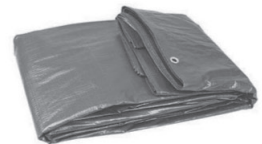
Bâches et films plastiques utilisés pour les travaux, la peinture.