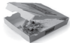
Papiers et cartons souillés, tels que mouchoirs, papier de ménage, cartons de pizza.