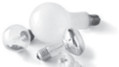
Petits bris de vaisselle, de vitres, de miroirs, ampoules à filament.