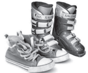
Textiles et chaussures hors d'usage ou souillés.